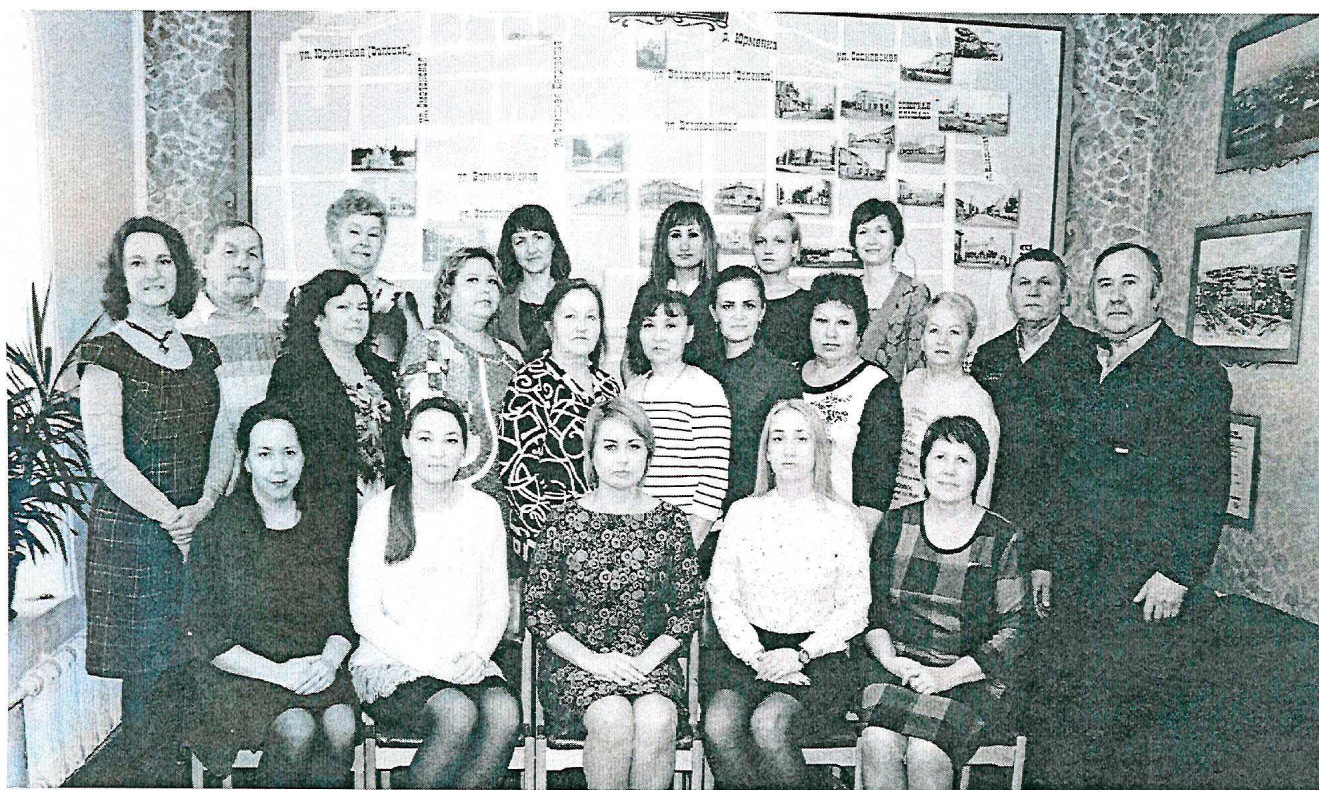
Коллектив архива. 2018 г.