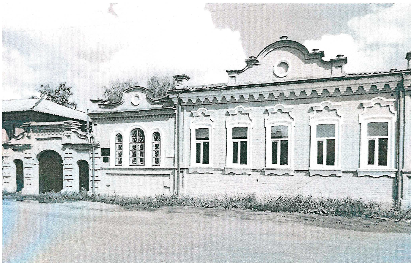
Здание Управления по делам архивов Администрации города Сарапула